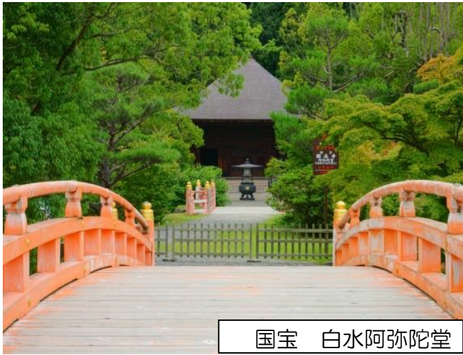
国宝 白水阿弥陀堂