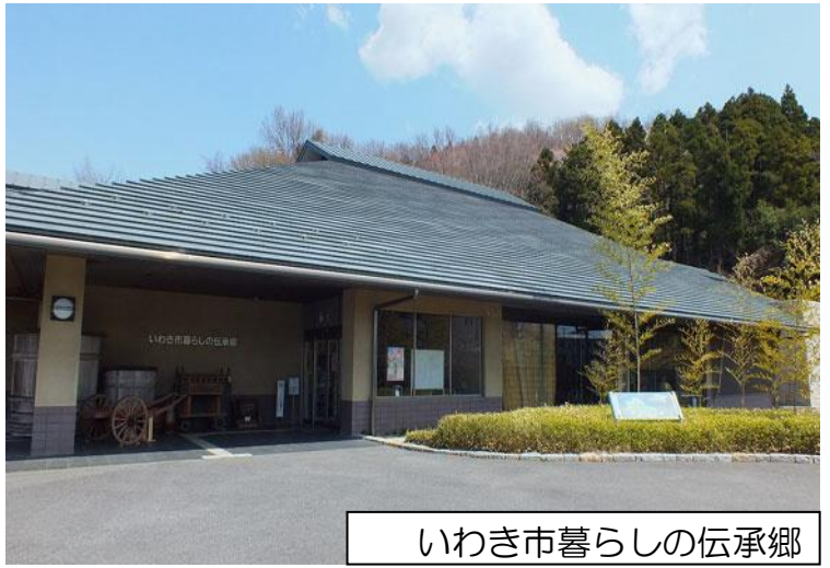
いわき市暮らしの伝承郷