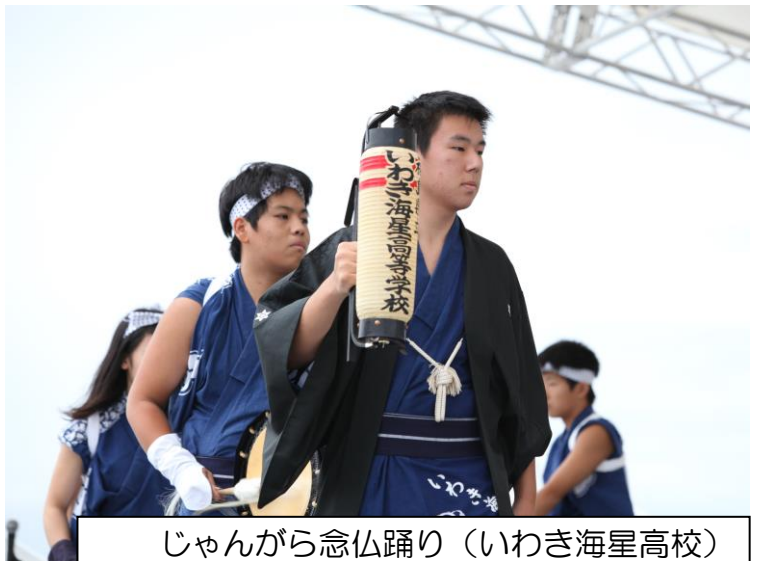
じゃんがら念仏踊り（いわき海星高校）