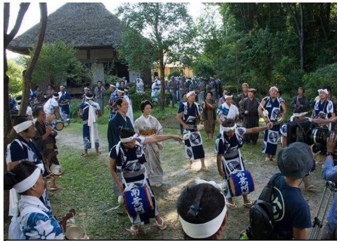
映画「超高速！参勤交代リターンズ」でのじゃんがら念仏踊りの撮影シーン（いわき市暮らしの伝承郷にて）