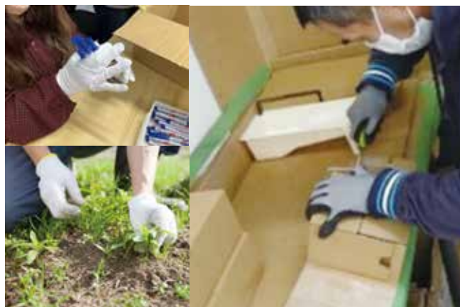
● 様々な作業依頼にも対応