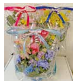
▲フラワーアート…1個 ¥1,580 リビング・玄関・お手洗いのインテリアにもお勧めです。