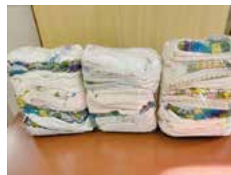
▲ウエス……………1袋 ¥100 不要になった生地をカットしウエスにしました。