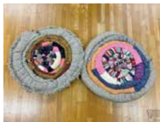
▲クッション……………1個 ¥1,000 手織りの織物をクッションにしました。

✉ terasu@blue.ocn.ne.jp 【定休日】水・木・年末年始 【営業時間】9:00～16:00