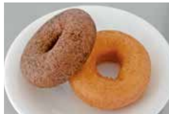
▲とうふドーナツ…2個入 ¥150 絹豆腐を使用したもちもちでふわっとした食感。一番人気の揚げドーナツです。プレーン/ココアの2種類があります。

✉ atorie@kibounomori.or.jp 【定休日】土・日・祝 【営業時間】8:00～17:00