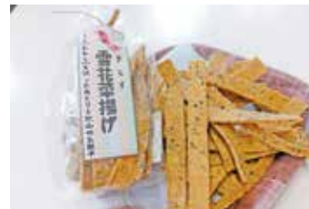
▲きらず揚げ……1個 ¥200 おからと豆乳を使用したどこか懐かしい揚げ菓子。素朴な味わいでロングセラー商品です。