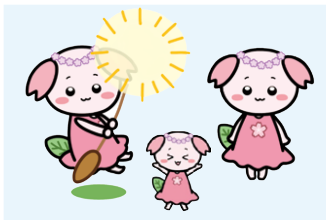
● イラスト作成もおまかせ