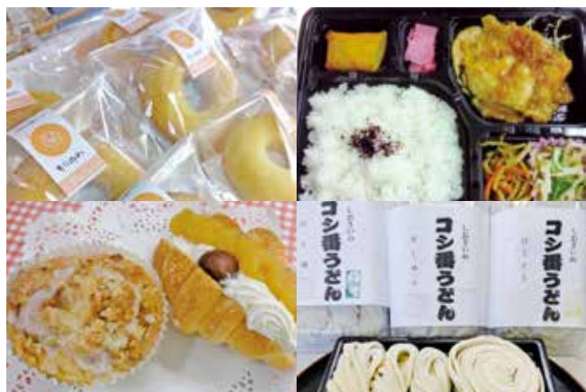
● 美味しい出会いもきっとある

いろいろな事業所で、いろいろな人たちが、いろいろな想いを込めて作ったハンドメイドの逸品たちを、身近な生活や仕事で活用してみましょう。きっとみなさまの身の回りが便利で豊かになるはず。「こんな場面で使ってみては!?」ということで活用例をいくつかご紹介します。