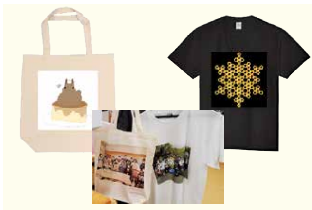
● みんなと違ったオリジナルアイテム