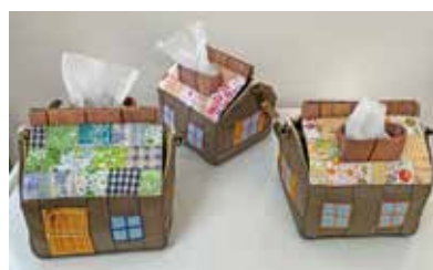
▲トイレトペーパーホルダー …1個 ¥1,500 ハウス型のホルダーで、屋根パッチワークで可愛く仕上げました。

✉ dodo2.toyoma@gmail.com 【定休日】土・日 【営業時間】9:00～17:00