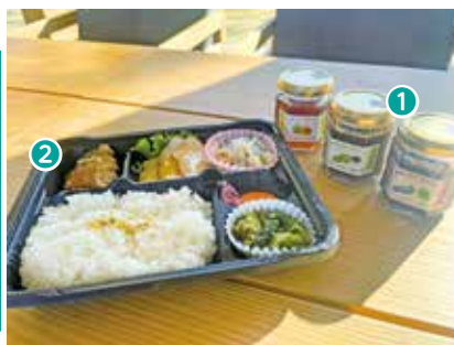
①手作りジャム ……………110g ¥378～ ぶどうジャム、にんじんジャム、キウイジャム、ルバーブジャム、梨ジャムなど保存料添加物は使用せず素材の味を活かした手作りジャムです。

✉ miraikoubou@midorinomori-f.com 【定休日】土・日・祝・年末年始 【営業時間】8:30～16:30