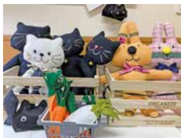
さをり織り製品 ……………1個 ¥200～ コースターなど小物からトートバッグなど大判までを受注生産

✉ alive@ciliwaki.jp 【定休日】土・日・祝・盆・年末年始 【営業時間】9:00～17:00