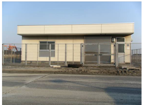
分岐施設（電源設備）