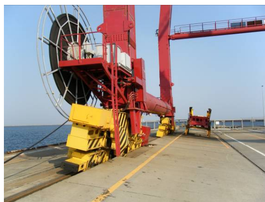
ガントリークレーン