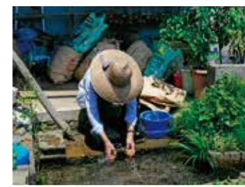
平成29年度水道週間写真展 最優秀賞作品