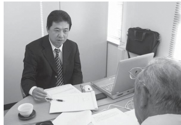
特許相談では申請についてなど、さまざまな相談が可能