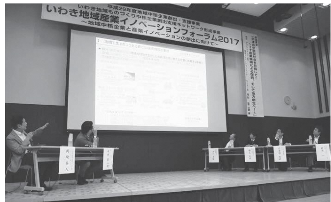
新たな時代に対応する産業の創造に向け、フォーラムを開催

新に向けた特許相談、助成金の活用支援、共同研究活動の奨励による事業化支援などがあります。さらに、起業に係るセミナーの開催や、創業者を対象とした相談窓口の開設なども行っています。 中でも、中小企業の技術開発と販路開拓の支援を重点的に実施しています。国などの補助金を活用しながら、バッテリー産業や風力関連産業、医療分野等の中核となる企業の研究開発・事業化支援や、企業間の技術連携・海外販路開拓などを積極的に推進しています。 ○中小企業の技術・研究開発などで果たす大きな役割 同協会は、設立以降、約十年間にわたり、国や県等の補助金約二十億円を市内に還元するなど、中小企業の技