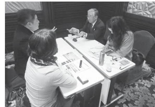
海外での販路拡大のため台湾での商談に臨む株式会社シンテック

○公益社団法人いわき産学官ネットワーク協会の誕生 企業誘致に依存した産業振興が限界を迎える中、産学官連携の下、本市のさらなる経済活性化のため、企業に対して一元的・総合的な支援を行う基盤の早急な整備を望む声が高まりました。平成十五年から具体的な検討が開始され、平成十六年の任意団体の設立を経て、平成十八年に社団法人いわき産学官ネットワーク協会が設立されました(平成二十五年に公益社団法人化)。産業支援センターの機能を備えた同協会の設立は、産業界の発展に大きく貢献しました。 ○さまざまな支援事業を実施 同協会の事業には、ものづくり塾や知財塾の開催による人材育成、経営革