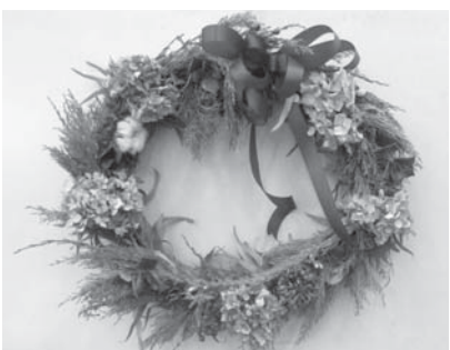
クリスマスリース

時16時 内シクラメン・ピオラの展示・販売、手描きカップ作り、クリスマス用ドアペル作り、花苗木等の販売など