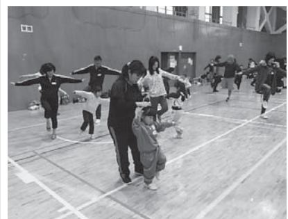
親子で仲良く運動

期11月20日(月)必着 ※かんたん申請・申込システム(市ホームページ)からも申し込みができます。