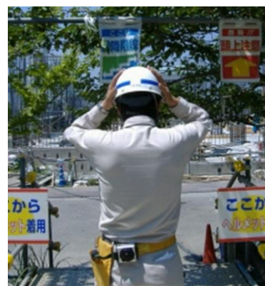
【充実した育成力で優れたガスパーソンへ】

その他にも随時メーカーでの最新ガス機器の勉強会、機器修理の研修、講習なども受けてもらい、業界のトレンドを抑えてもらうように努めています。