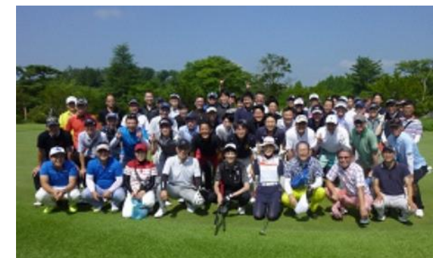
【各地の仲間と親睦を深める行事も豊富】

また、例年夏に行われるゴルフコンペや冬に行われる雪の集いなど全社的に行うレクリエーション行事もあり、各地の仲間と親睦を深める機会も設けています。このように当社では社員の健康面だけでなく、人とつながりの創出に向けた取組みも充実させています。