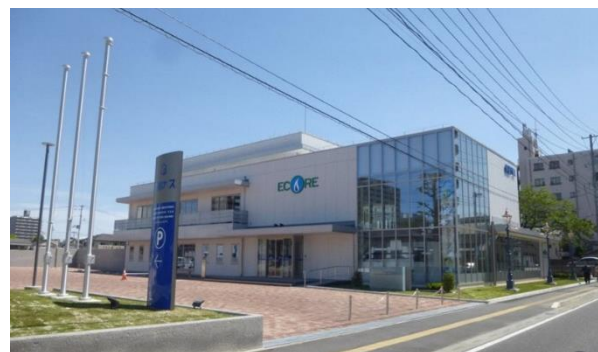
【東部ガス株式会社 福島支社平事業所】

東部ガス株式会社は、東北・関東地方の3県において都市ガス供給をはじめとして、ガス製造・販売、エネルギー関連の事業を展開するほか、近年は、そのノウハウを発展させリフォームなど住環境の提案も行っています。