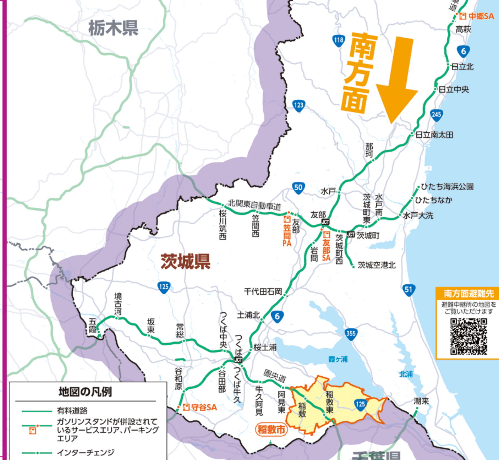
南方面避難経路周辺地図 1:15,000