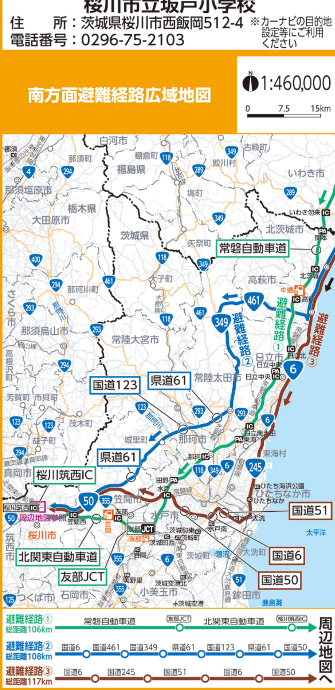
南方面避難中継所 桜川市立坂戸小学校 住所：茨城県桜川市西飯岡512-4 電話番号：0296-75-2103 ※カーナビの目的地設定等にご利用ください

この地図の作成に当たっては、国土地理院長の承認を得て、別院発行の50万分1地図図、2万5千分1地形図及び電子地形図25000を使用した。(承認番号 平29第444-239号) 地図は、2017年9月時点のセンサスデータに基づき作成しており、各種データを含めた地図内容は発行時に変更になる場合がございます。 ※避難経路の総距離は、いわき市境から避難中継所までの概算距離を示しています。避難経路①～③は、運転しやすい順の経路になります。 スマートフォン2次元コード読み取りソフトによっては、2次元コードの読み取り・地図表示ができない場合がございます。 2次元コードから避難中継所の場所を表示する地図サイトは、予告なく、サービス終了となる場合がございます。