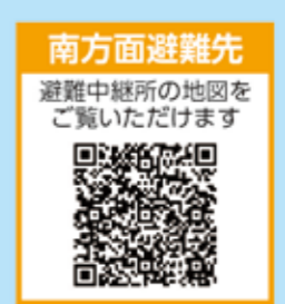
南方面避難経路周辺地図 1:10,000