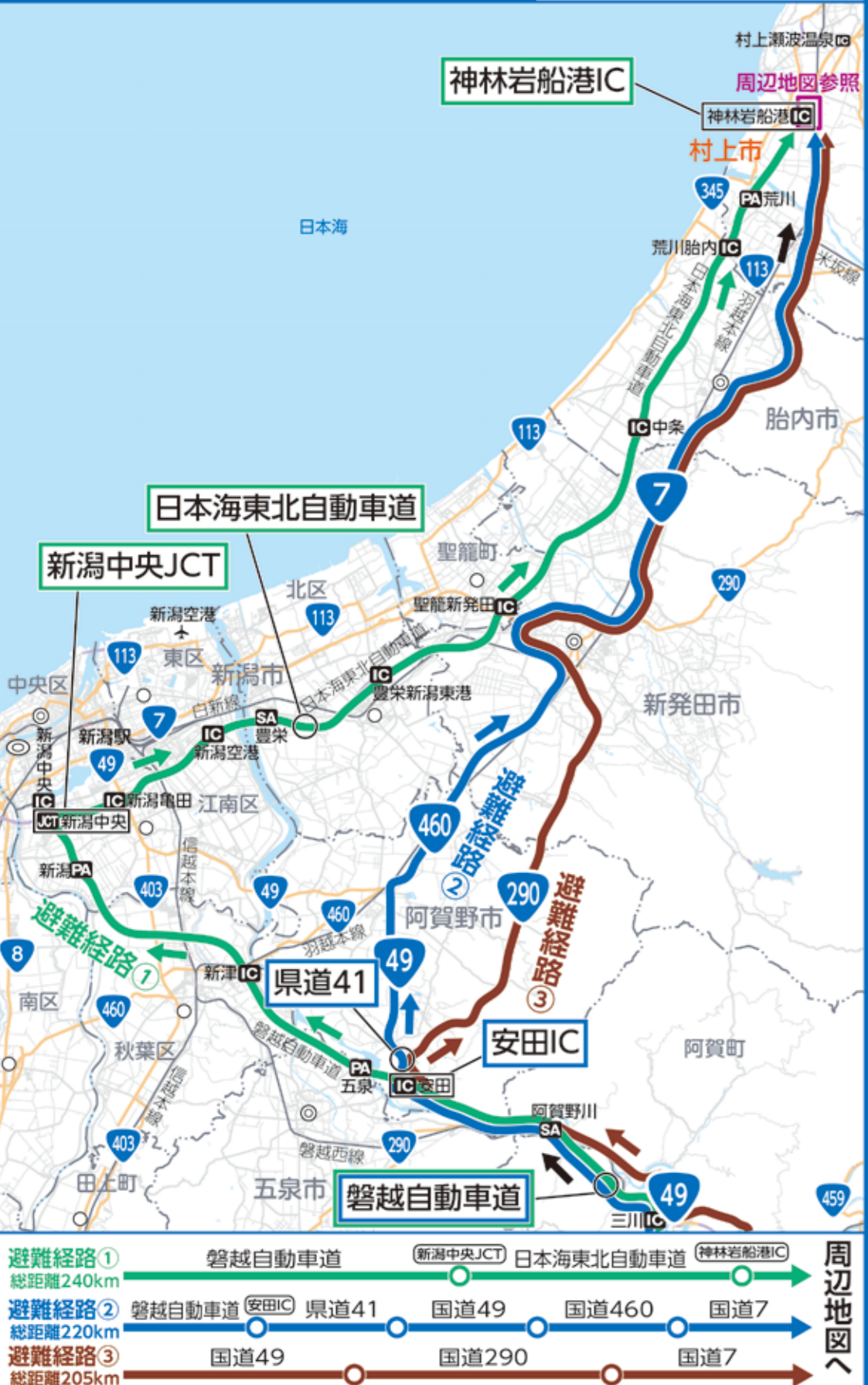
西方面避難経路広域地図 1:280,000