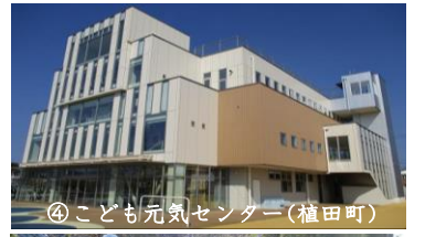
④子ども元気センター(植田町)

H25年度：設計委託等 H26年度：新築工事・公園整備着工 H27年度：新築工事・公園整備完了 ※ 平成28年4月1日から「子ども元気センター」供用開始