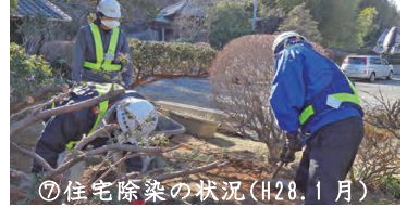
⑦住宅除染の状況(H28.1月)

H26年度：新舞子ハイツヘルスパール棟の改修工事を実施(H25.12～H27.2)