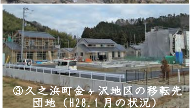
③久之浜町金ヶ沢地区の移転先団地 (H28.1月の状況)

(実施地区/施工面積) 久之浜/28.3ha 薄磯/37.0ha 豊間/55.9ha 小浜/3.8ha 岩間/12.5ha H27年度：宅地造成、公共施設整備工事、宅地引渡し (54区画) ※ H29.12月までに、全ての地区で宅地の引渡しの完了(全838区画)を目指す