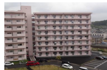
①常磐関船団地 H26.3月入居開始

H25年度：32戸整備 H26年度：807戸整備 H27年度：674戸整備 合計：1,513戸整備 (内訳) 平：430戸 小名浜：189戸 勿来：237戸 常磐：120戸 内郷：250戸 四倉：151戸 久之浜：136戸