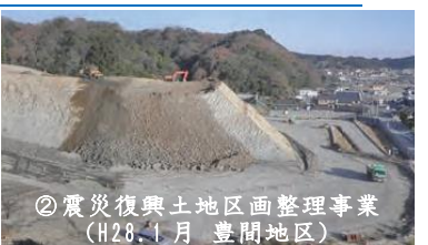
②震災復興土地区画整理事業 (H28.1月 豊間地区)

(実施地区/施工面積/戸数) 常磐西郷町忠多/2.6ha/50戸 泉もえぎ台/6.5ha/84戸