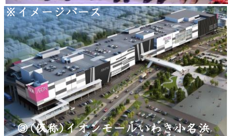
③(仮称)イオンモールいわき小名浜

H23年度：イオンモール(株)とパートナー基本協定締結等 H26年度：小名浜港湾合同庁舎(国)移転完了 H27年度：小名浜港湾建設事務所(県)移転完了 ※ 平成28年8月22日起工式、平成30年夏頃オープンを目指す 敷地面積：39,400㎡ 建築面積：27,000㎡ 延床面積：94,000㎡ 建物構造：鉄骨造(地上5階建)