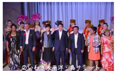
②いわき太平洋・島サミット

H24年度：太平洋諸国舞踊祭の開催等 H27年度：第7回太平洋・島サミット (H27.5.22～23)