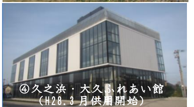
④久之浜・大久保あい館 (H28.3月供用開始)

(実施地区/施工面積/戸数) 末続/0.7ha/10戸 金ヶ沢/0.6ha/10戸 走出/0.1ha/3戸 錦町須賀/0.7ha/19戸 ※ H26年度までに全ての地区で移転先住宅団地が完成し、宅地の引渡しを開始