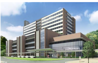
①新病院完成イメージ

H23～26年度：基本構想・基本計画の策定、基本設計、実施設計 H27年度：本体工事着工 (起工式) ※新病院は平成30年12月に開院予定