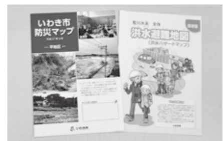
防災マップ等で危険箇所や避難所などの確認を

災害から身を守るためには、防災・気象情報などの緊急情報を収集することが重要です。市では「市防災メール配