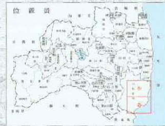
総括図 いわき都市計画区域