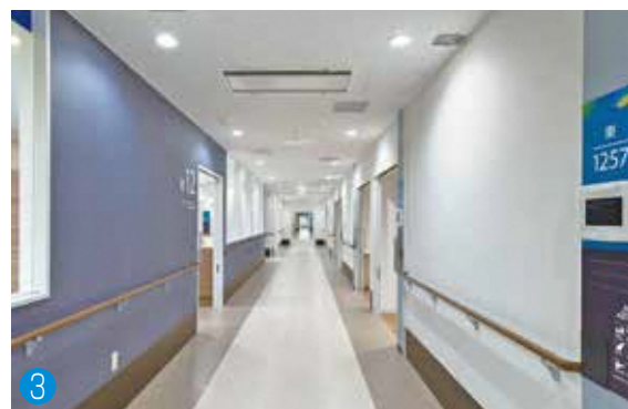
(結核病床15床と併用 陰圧機能付き病床)