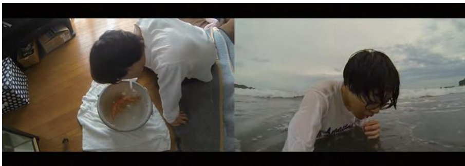
図1 《あの日の記憶から》2017年 映像