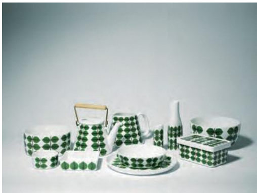
[ベルサ]装飾、[LL]モデル/ディナーセット 1957年/ モデル、1960年/装飾 リンドベリ家コレクション © Stig Lindberg

スティグ・リンドベリ(1916-1982)は、スウェーデンの陶芸家・デザイナーです。1937年にスウェーデンのグスタフスベリ磁器工房に入社し、鮮やかな葉っぱの模様がさわやかな[ベルサ]シリーズなど、世界中に知られる名作プロダクトを手がけました。機能性とは何か、調和や美とは何かを追求し、独創的なアイデアをもとに新たな表現方法へと挑戦し続けた彼のデザインは、現在もなお高く評価され、没後40年以上を経た今も多くの人々に親しまれています。