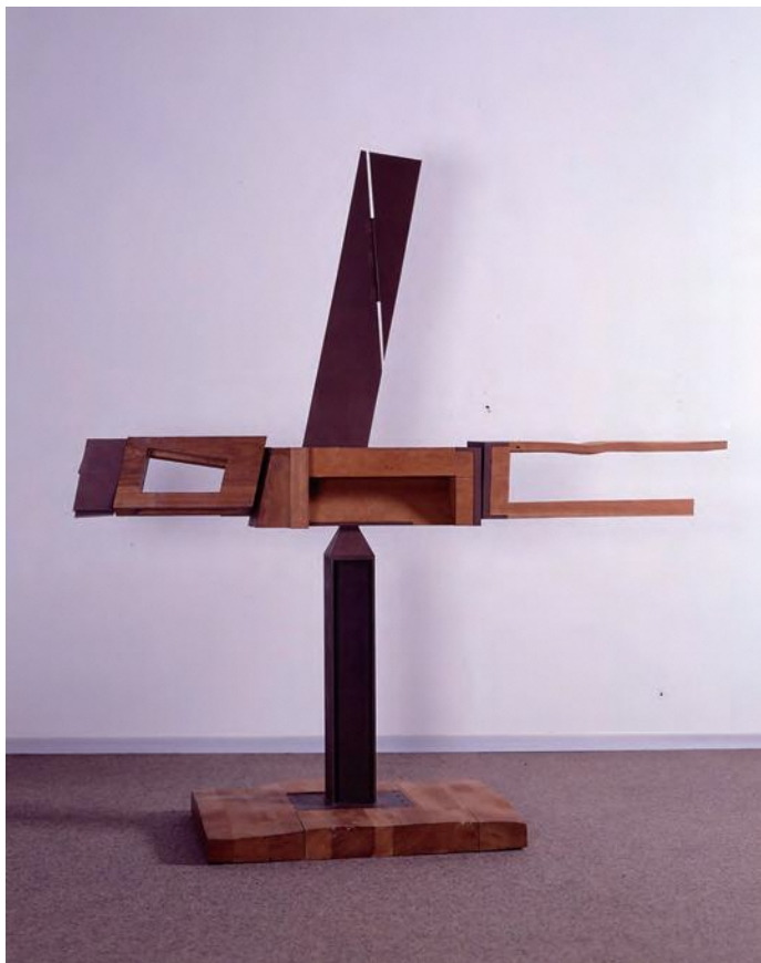
土谷武《向かい風》1980年 軟鋼、コルテン鋼、木(チーク) 235.0×225.0×89.5cm