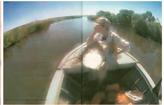
左 『anan』表紙(4号、1970年) 右 『anan』中面(45号、1972年) 平凡出版 ©マガジンハウス ©Seiichi Horiuchi

やそのアートディレクションをひも解く「FASHION」の章、ファンタジー色の強い絵本の原画を展示する「FANTASY」の章、そして100人以上のクリエイターや編集者などが堀内の魅力を伝え、その仕事を未来につなげようとする「FUTURE」の章による三部構成で、堀内誠一の多彩な仕事を紹介します。