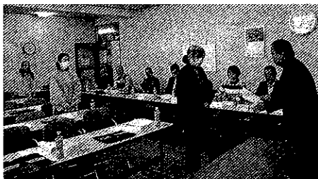
一日少年補導員の委嘱を受ける参加者

令和元年度は、四倉・久之浜方部の保護者7名に参加いただき、本市の少年補導の概要や補導員の心得などを説明した後、補導車による街中の巡回や青少年への声かけなどを体験していただきました。