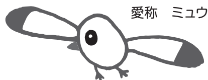
愛称 ミユウ 市の鳥「カモメ」のイメージキャラクター「ミユウ」

Q 3 小・中学校に就学している児童・生徒に学用品等の援助制度があると聞いたのですが……。