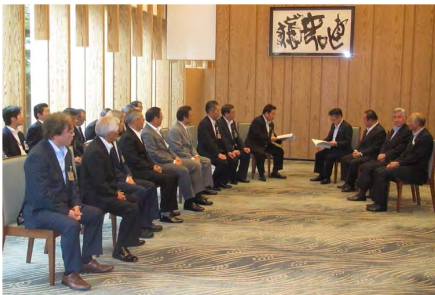
首相官邸で行われた双葉郡 8 町村（双葉地方町村会）との合同要望（平成 26 年 6 月 30 日実施）