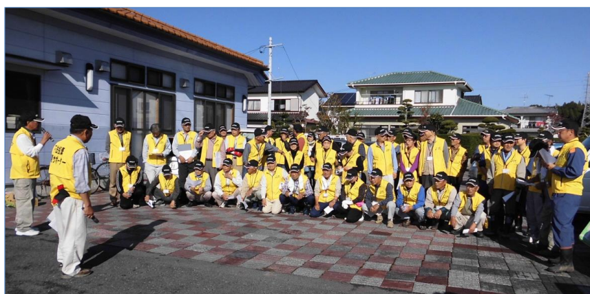
▲ 平31区が実施した不法投棄実態調査・パトロールの出発式の様子