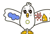
いわき市ごみ減量キャラクター クリンビー