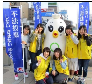
地区別サポーター数

本通信は、不法投棄監視サポーターに御登録いただいた皆様及び 市民の皆様に、本市の不法投棄の現状や、様々な取り組みなどを 情報発信するものです。