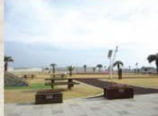
■整備進むふれあい広場