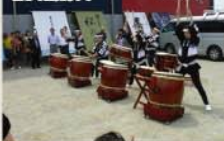
■オープニングイベント