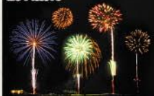
■鎮魂の花火～絆と光～