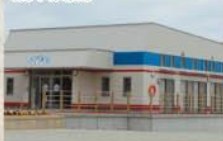
■チャイルドハウスふくまるオープン