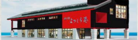
■交流館リニューアルオープン