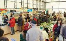
■大型テントで仮営業