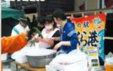
■道の駅での炊き出し