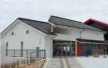
■情報館再オープン