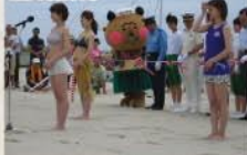
■四倉海水浴場海開き