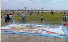
■いわき風揚げ大会