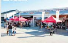
■土日のみ仮営業始まる