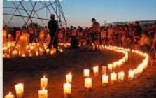
■灯そうふくしまに光を