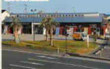
■よつくら港交流館OPEN