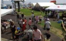
■リニューアル周年記念イベント