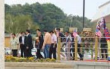
■ケネディ大使来館