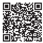
市の指定避難所等