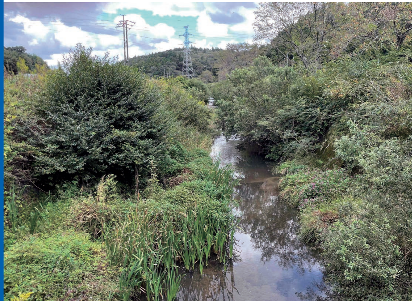
深山口川（下流部）令和7年10月7日

このマップは、福島県が作成した洪水浸水想定区域図に基づき、洪水時の浸水状況を示した「マップ」と、平時から確認しておく「防災情報」をまとめたものです。ご家庭等に常備いただき、防災マップ等と合わせてご活用ください。