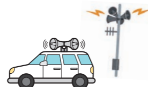
広報車・防災行政無線