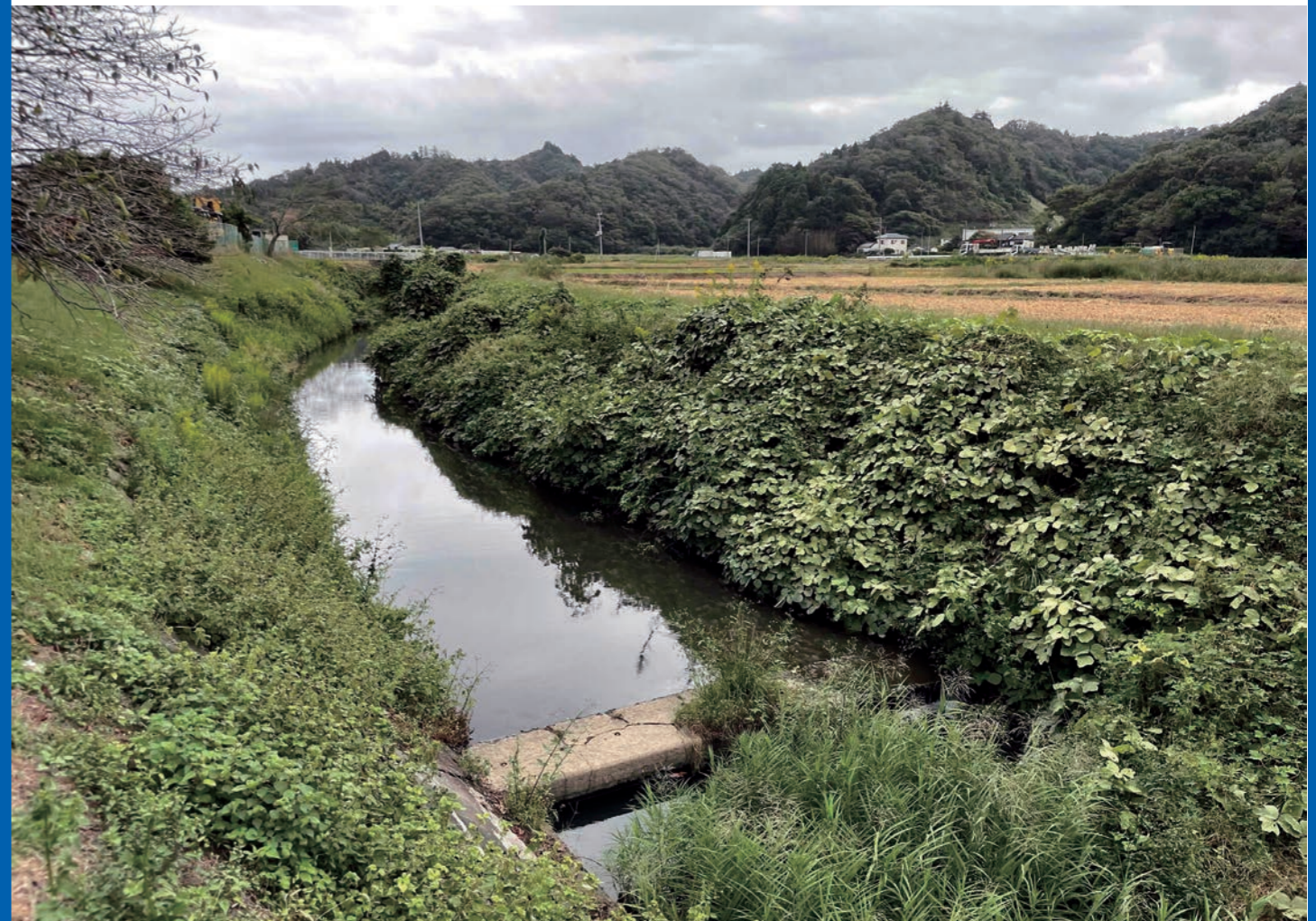
蔵持川(中流部) 令和7年10月7日

このマップは、福島県が作成した洪水浸水想定区域図に基づき、洪水時の浸水状況を示した「マップ」と、平時から確認しておく「防災情報」をまとめたものです。ご家庭等に常備いただき、防災マップ等と合わせてご活用ください。