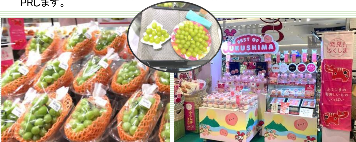
8月の福島県産「桃」のPRイベントの様子