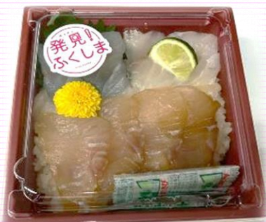
フェア限定「ヒラメ2色丼」