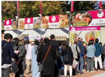
大型イベント「お魚まつり」