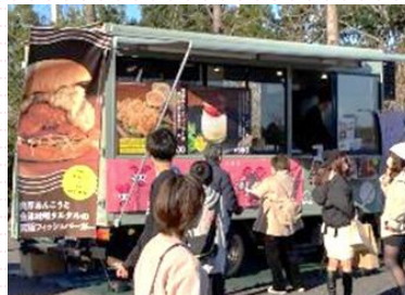
キッチンカー出店