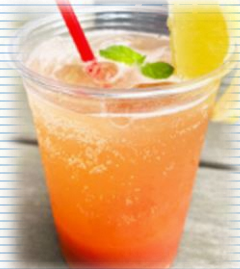
トマトジュースの炭酸割り