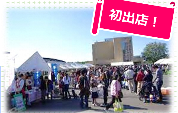
会場の様子(2019年)イメージ