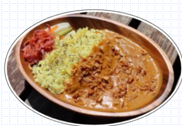
ベジタブルポターージュカレー (田村市野菜使用)