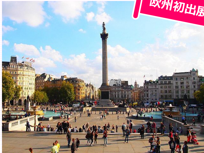
トラファルガー広場(イメージ)