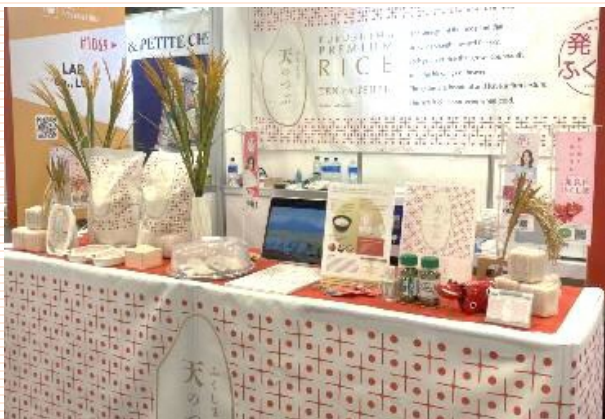
PRブースの様子 (イメージ)