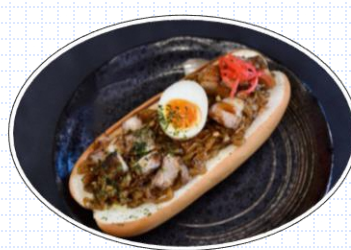
ラーメン屋が本気で作った 炙り肉焼きそばドッグ