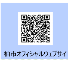
柏市オフィシャルウェブサイト