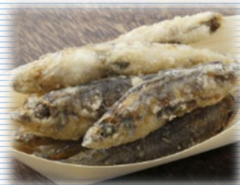
メヒカリの唐揚げ