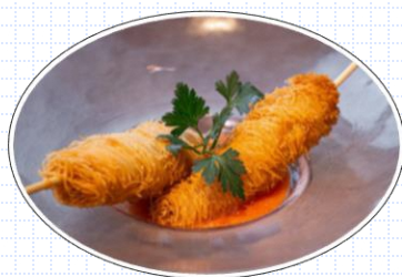
常磐もの鮮魚のパリパリ揚げ