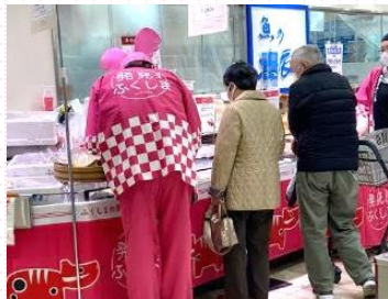
小売店での販促イベント