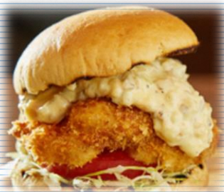
あんころのフィッシュバーガー