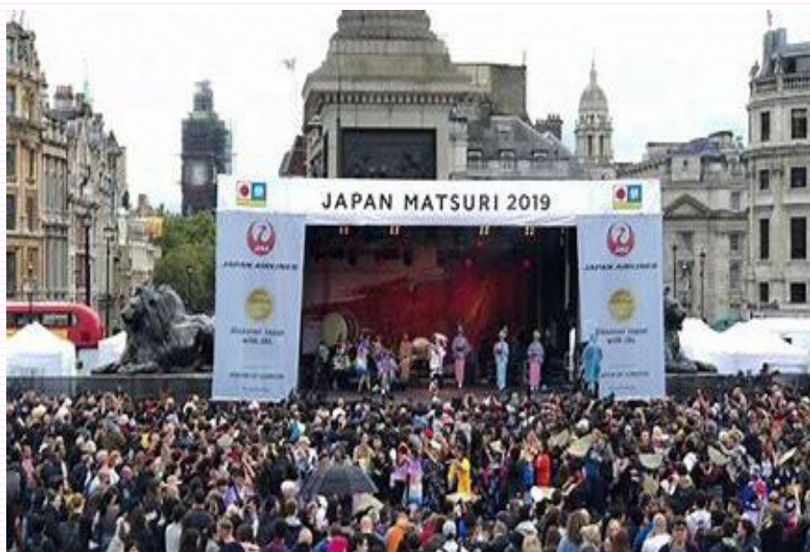
ジャパン祭り2019(イメージ)