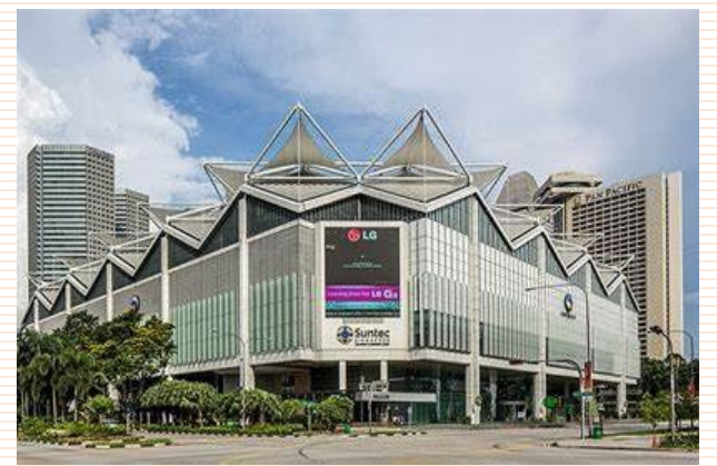
サンテック・シンガポール国際会議展示場(会場イメージ)