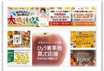
E C サイトキャンペーン