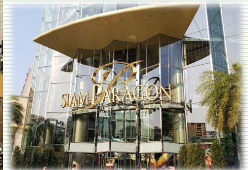
グルメマーケット サイアムパラゴン (会場イメージ)