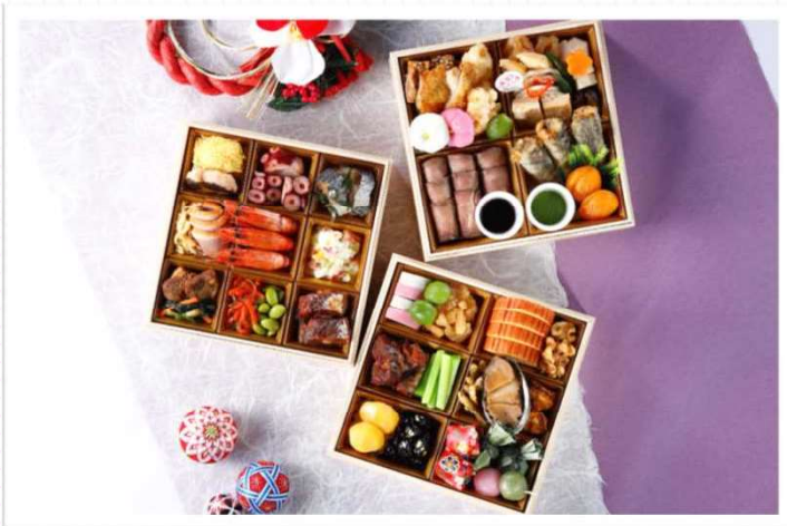
ふくしま初夢おせちイメージ