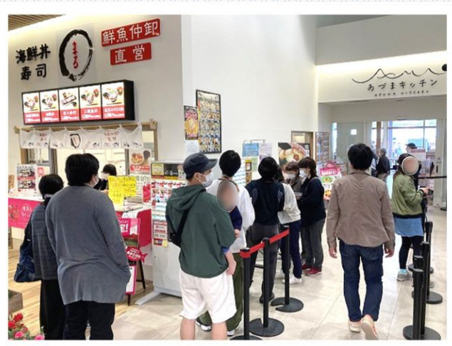
フードコートの様子