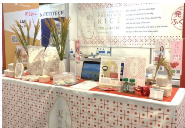
出展ブースの様子(2023年1月)