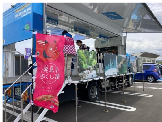
移動水族館「アクアラバン」