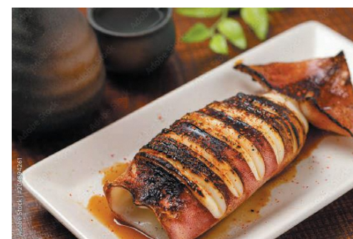
常磐ものイカ焼き