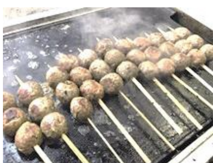
さんまのポーポー焼き