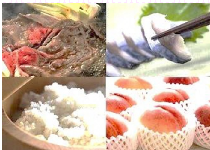
販売商品 (イメージ)