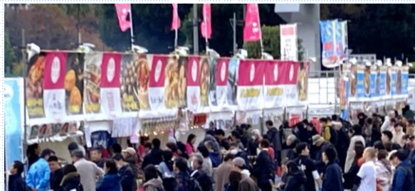
「発見！ふくしま」エリアの様子