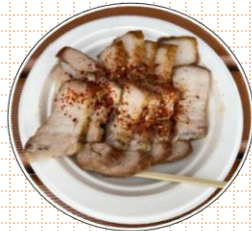
「うつくしまエゴマ豚」の焼肉