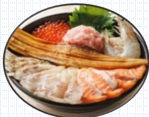
ノドグロ&はねる生エビ入り 福島全部のせ丼