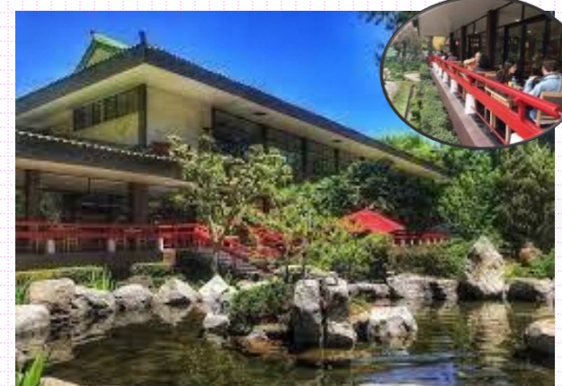
日墨会館(イメージ)