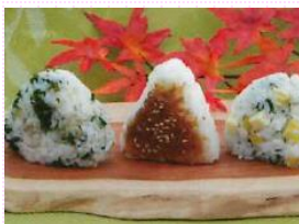
握りたておむすび