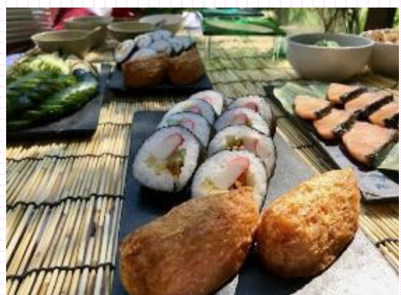
提供メニュー(イメージ)

※参考「日墨(にちぼく)会館」 1959年1月30日にメキシコシティの南に開館。日本風家屋の本館に和食レストラン、パーティー会場、スポーツ施設などがある会館。