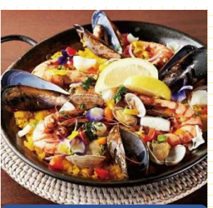
福島県産日替わり鮮魚入りシーフードパエリア