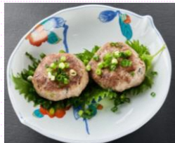
さんまのポーポー焼き