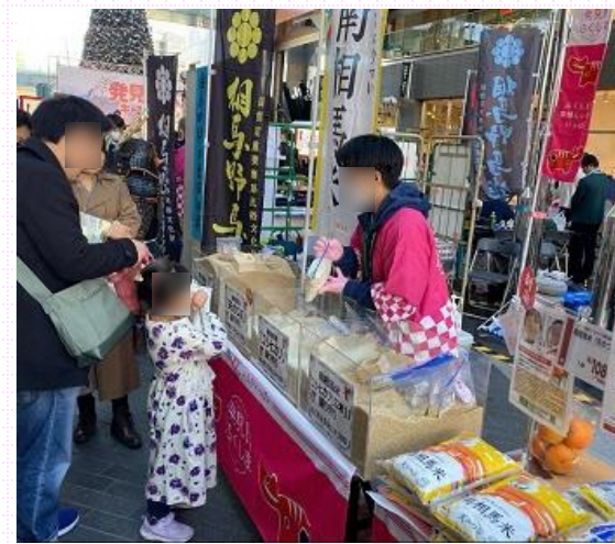
新米販売ブースの様子