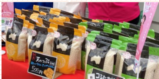
「天のつぶ」新米の販売