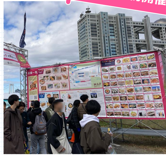
会場出入口の様子