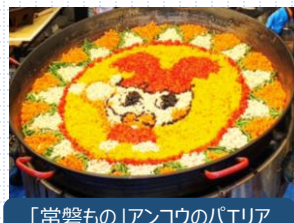
「常磐もの」アンコウのパエリア