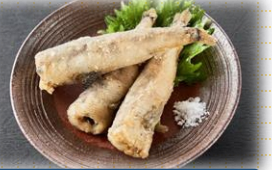
常磐ものメヒカリの唐揚げ