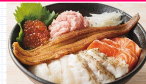
ノドグロ入りふくしま全部のせ丼