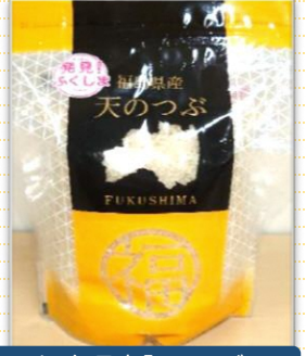
福島県産「天のつぶ」