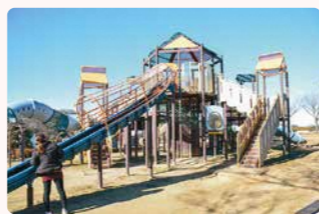
▲いわき公園 平上高久字大日作 ☎29-1684