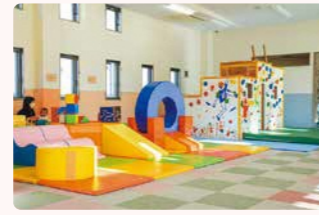
▲チャイルドハウスふくまる 四倉町字五丁目 ☎88-9940