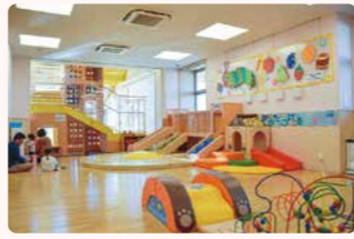
▲こども元気センター 榎田町本町一丁目 ☎63-2884