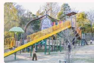
▲21世紀の森公園 常磐湯本町上浅貝 ☎43-0033