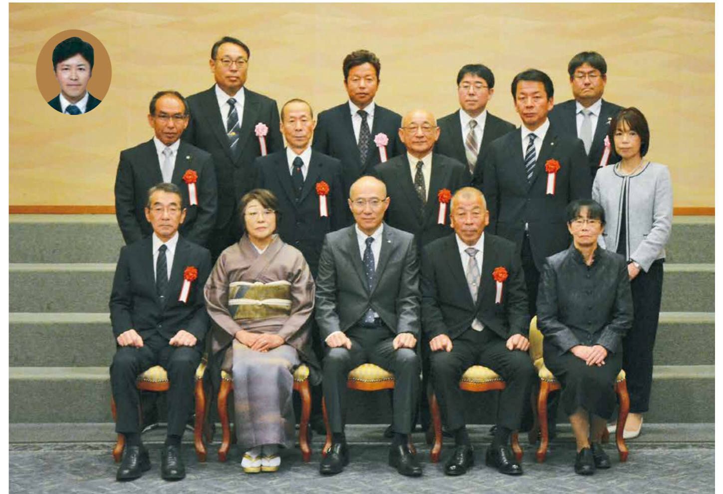
▲受賞者の皆さんと下山田副市長(中央)