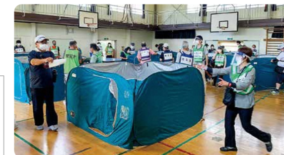
8時30分に沿岸部には、防災行政無線でサイレンが鳴ります。津波避難場所など安全な場所に避難してみましょう。