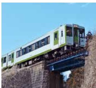
▲川前町の石積みの鉄道橋を渡るJR磐越東線

問 磐越東線活性化対策協議会における取組は、 答 鉄道の存続を前提として、活性化策の議論を進めます。