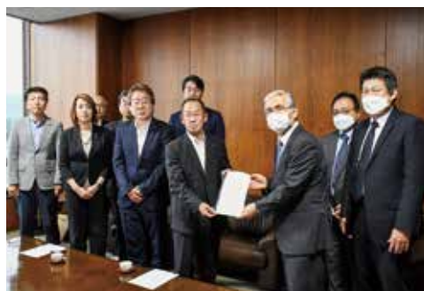
▲6月28日 東京電力に対し、決議を手渡した際の様子

よって、東京電力においては、ALPS処理水については、「関係者の理解なしにいかなる処分も行わない」との約束を履行することを強く求める。