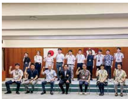
▲ 令和4年度「IWAKI NEXT」のメンバー

答 狙いとしていた能力の向上により、人材強化が着実に図られたと認識しています。この取組を日常的なものとして、育てた人材を循環させ、改革・改善を組織風土として根付かせるためにも、引き続き、活動を継続していきたいと考えています。