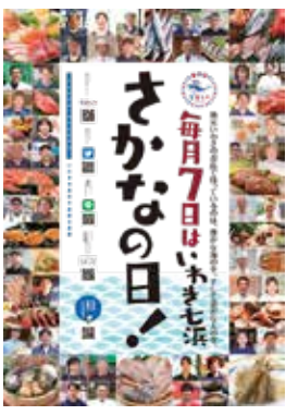
▶さかなの日推進ポスター