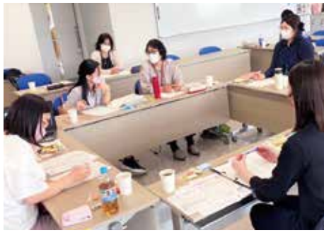
▲「ひとしおLab」の打合せの様子

ロジェクトとして、管理栄養士の資格を持つ職員を集めた「ひとしおLab」を立ち上げ、減塩レシピの開発を進めます。また、その成果をオリジナル減塩レシピブックの作成や学校・保育給食へのレシピ提供、小売店との連携による商品化につなげ、市民の食卓における減塩のさらなる普及促進を図ります。