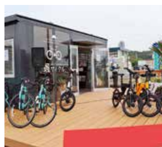
▲四倉町にあるサイクリストつぶ「颯サイクル」

「サイクリストつぶ」サイクリングを楽しんでもらうため、休憩場所やトイレの提供、サイクリンググッズの設置により、サイクリストをおもてなしする店舗。