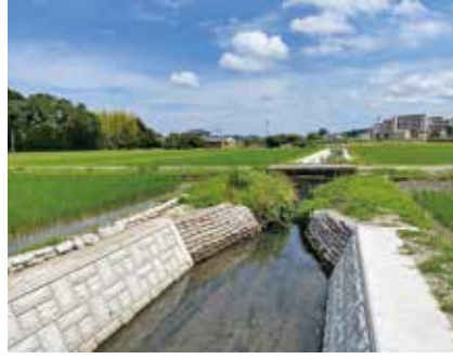
▲ 山王田川の施工予定箇所

答 河川堤防強化のため、普通河川山王田川など19河川について、河川内堆積土砂撤去のため、準用河川新田川など24河川について実施予定です。