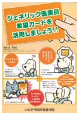
▶利用促進パンフレット

答 被保険者向けのパンフレットを配付しているほか、配付している保険証ケースにも利用を促す呼びかけを記載しています。