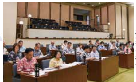
▲アロハ議会の様子