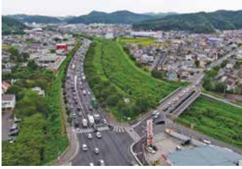
▲ 国道6号小名浜地区林城交差点の渋滞の様子

答 交通の円滑化に向け、民間団体とともに、国に対し、概略ルートや構造検討に係る調査等の加速化と渋滞対策の早期の計画策定を、強く働きかけていきます。