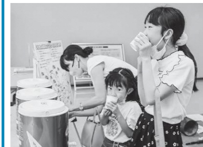
水の味に違いがあるんだね!