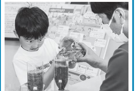
砂や砂利を通すときれいな水が出てきたよ!