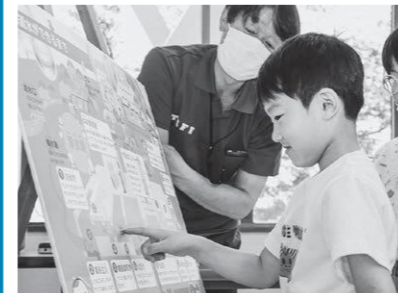
こうやって水道水はできるんだね!