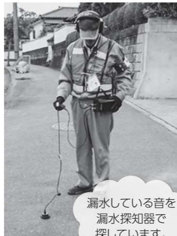
漏水している音を漏水探知器で探しています。

※調査は水道局職員のほか、水道局発行の身分証明書を携帯する受託者が行っています。 ※調査は昼間、お客さま敷地内の水道メーターの音を確認させていただきます。 ※調査費用を請求することはありません。 ※立ち会いは必要ありません。なお、ご不在でも調査をさせていただきます。