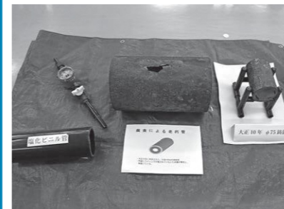
大正時代(約100年前)の水道管など貴重な資料を展示しました。