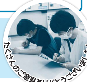
皆さんのご意見ありがとうございました!

水道に関するアンケートを行い、ご協力いただいた方に花の苗をプレゼントさせていただきました。