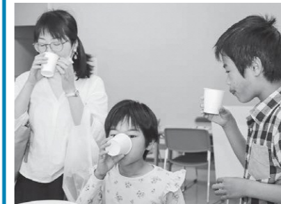
いわきの水道水と市販のミネラルウォーターを飲み比べてみたよ!