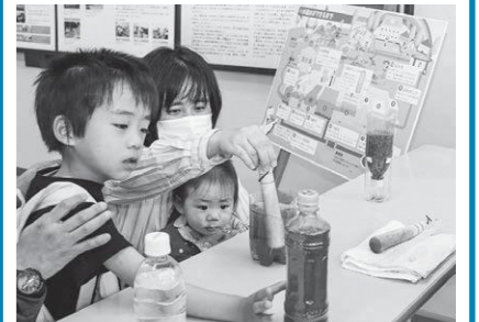
薬品を入れて泥水のごみを沈めたよ!