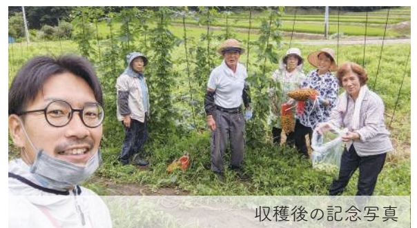
収穫後の記念写真