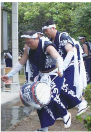
じゃんがら念仏踊り

「お盆にはやっぱりじゃんがらを見ないと!」という、地域の方の声を耳にしました。地域の文化や伝統を、今後も大切に繋いでいきたいと思えました。（長郷）