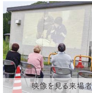
映像を見る来場者