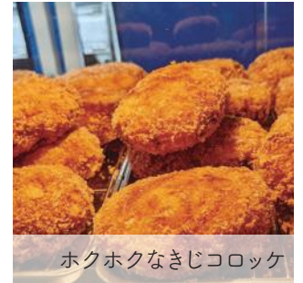
ホクホクなきじコロケ