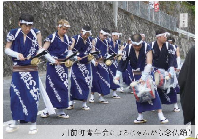
川前町青年会によるじゃんがら念仏踊り