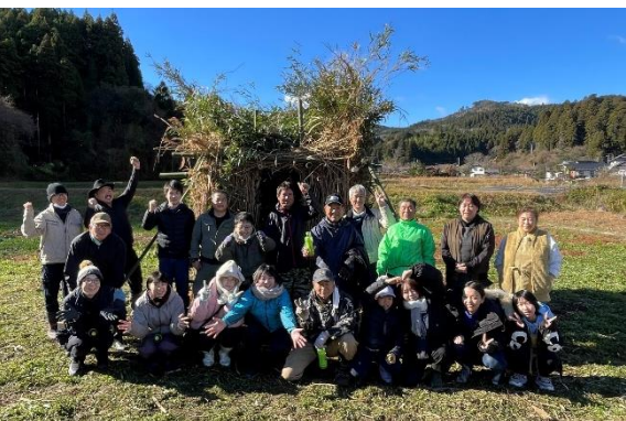
協力してくださったみんなで記念撮影をしました！このメンバー以外にも前日の材料集めを手伝ってくれた方や、材料提供など、今年も本当はたくさんの方に協力していただきました。本当にありがとうございました！！

例年丸一日を使って建てていた酉小屋ですが、今年は県内外からボランティアを募り3名の方の協力をもらいながら、前日に一部材料を集めておくことで、半日で完成することが出来ました。