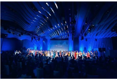
全国1300人の応募から日本大会に進んだのは70名

5ヶ月。自分自身の生き方と今後の展望、そして地域の今を伝えたい。そんな思いで自分と向き合い続け、自分に足りないもの、これからのキャリアに大切なもの、心の整え方や、スケジュール管理、沢山のことを学ばせて頂きました。大会の結果は賞を頂くことはできませんでしたが、しかし、これが今の自分の姿で今、自分にしか見えない世界があり、それを目いっぱい心で感じ涙が溢れたとても大事な時間を過ごさせてもらいました。沢山の応援本当にありがとうございました。この大会をきっかけにメディアやイベント等、本当に沢山の声にかけて頂けるようになります。今後自分の心を磨き続け、視座を高め活動に励んでいこうと思います。