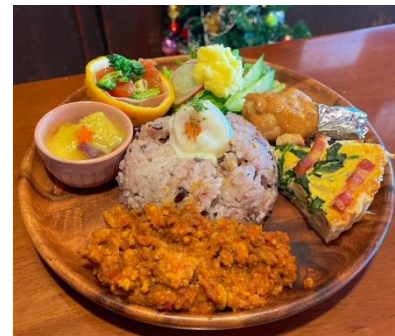
クリスマスオリジナル季節のベジカラープレート