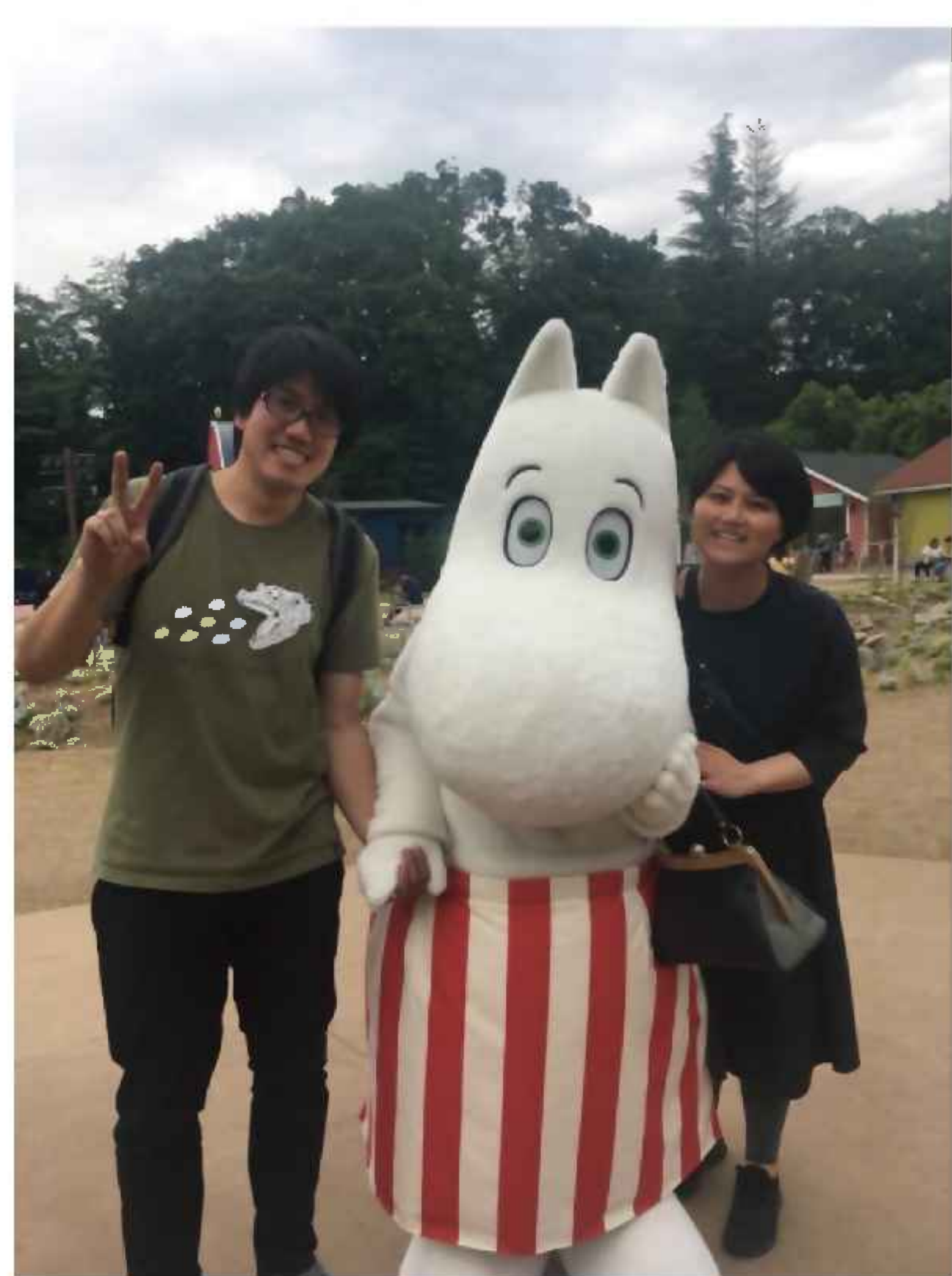
※真ん中は、ムーミンママです。一番右手が妻になります。

そういえば、妻が東京から越してきました。これで 田人の人口が一人増えます 。新型コロナウイルスのことを考慮して、軟禁をしておりますが、2週間たった6月1日からは、ふらふら田人を観光するかと思えます。どうぞ夫婦共々、今後ともよろしくお願いたします。