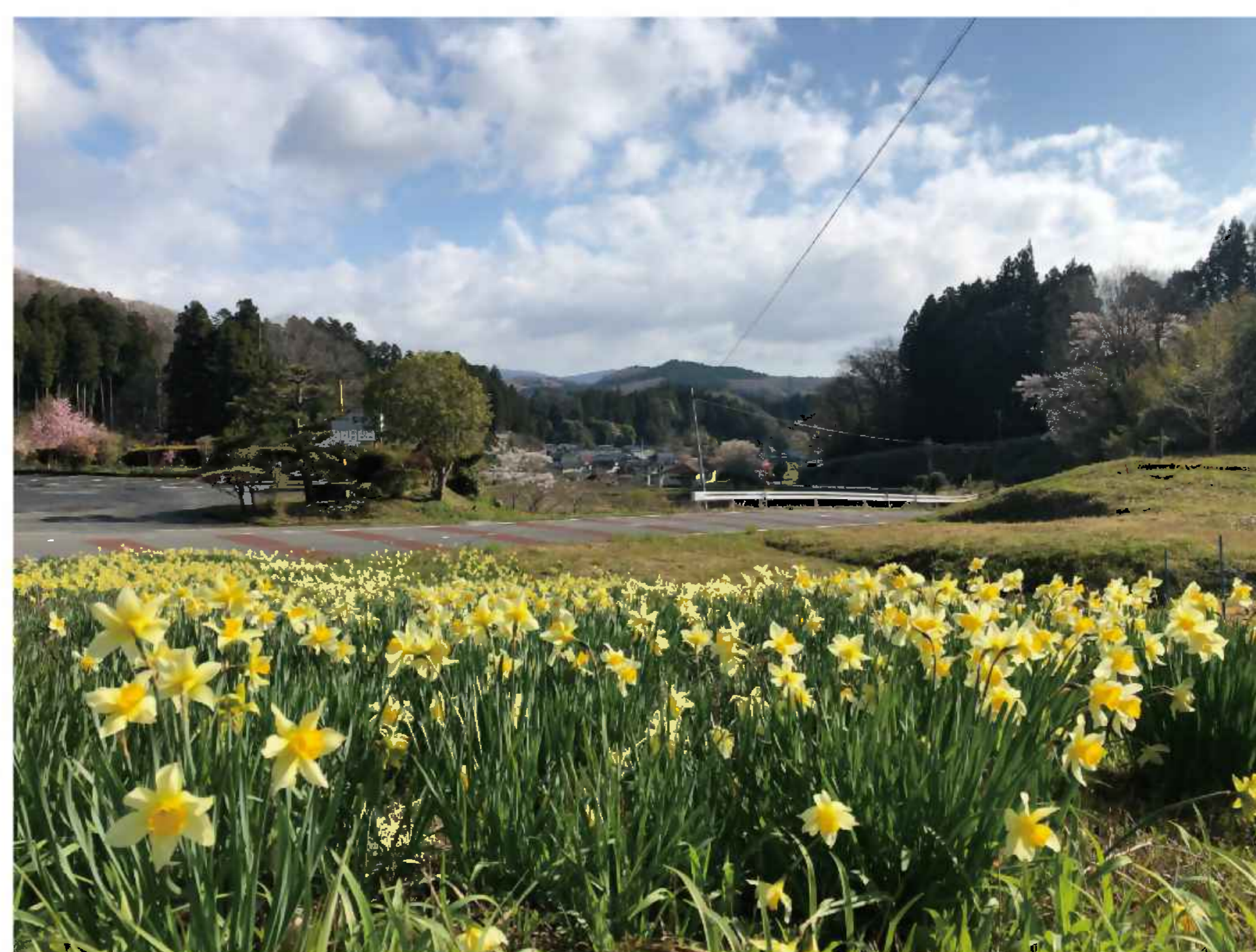
※写真は、ながせ食堂前にある大きなカーブから撮影をしました。 青空で気持ちの良い写真が撮れ、田人の風景お気に入りが増えました。