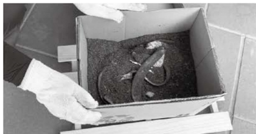
コンポストにごみを集めれば、自宅の生ごみから堆肥を作って家庭菜園などに活用できます

コンポストは英訳で「堆肥」。段ボールコンポストとは、段ボールを利用した生ごみ処理機のことです。毎日のように出る生ごみが堆肥に変身するため、燃やすごみを減らすことができます。