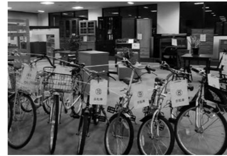
修理再生品の自転車

日9月10日(土) 10時抽選 料自転車 2千円、家具 3千円 申9月9日(金)までに同施設窓口で