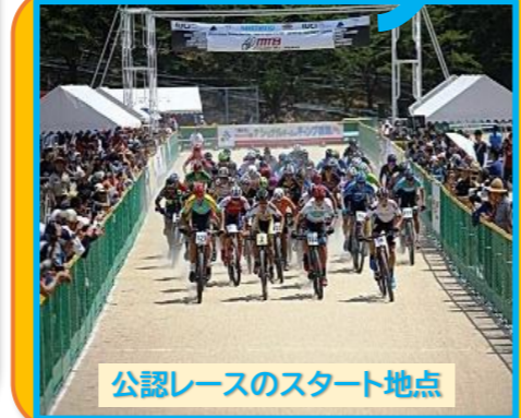
公認レースのスタート地点