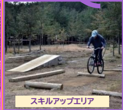
スキルアップエリア