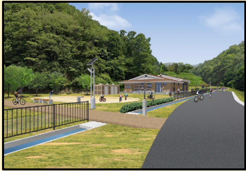
アイレベルパース図