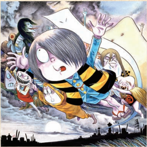
《ゲゲゲの鬼太郎》1985年