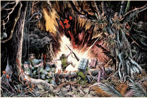
《総員玉碎せよ!—聖(セント)ジョージ岬・哀歌—》1989年