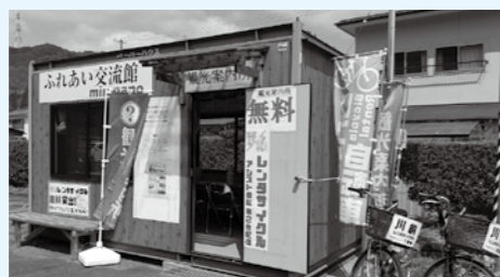
川前地区の情報発信拠点