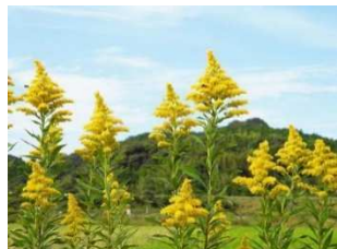
セイタカアワダチソウ