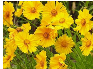
オオキンケイギク