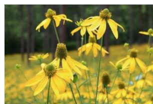
オオハンゴンソウ