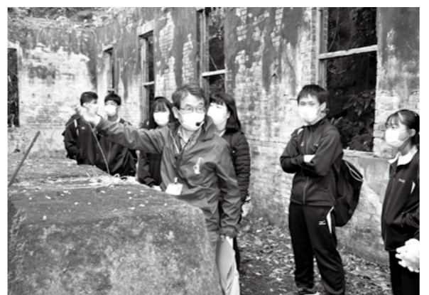
首都圏の中学生に炭鉱跡地を解説

Q NPO法人常磐炭田史研究会とどのような団体ですか。 私たちは産業・文化・社会など各分野に影響をもたらした常磐炭田地域の石炭産業について研究をしています。私は常磐炭田株式会社で働いていたときに、会社の先輩に誘われて会員になりました。平成十五年に設立し、現在は約七十人の会員で活動しています。 Q どのような活動をしていますか。 今年は常磐炭田株式会社磐城礦業所の閉山五十年ということで、企画展やゆかりの場所を訪ねる巡検、テーマごとの勉強会、公民館などと連携した講座を開催しています。いわきには親や祖父が炭鉱で働いていたなど、炭鉱にゆかりのある方が多く、勉強会を開催すると多くの方