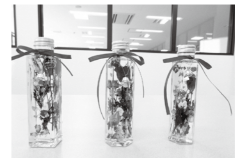
ビジュアールハーバリウム

対市内居住者で、全日程を受講できる方 フリントの家 ☎56・3651 ○リサイクル教室の参加者 日①布ぞうり②11月5日(金)②空き瓶でサンドブラスト③空き瓶でビジュアール④11月11日(木)③空き瓶でビジュアール④11月24日(水)④自然素材でリース⑤11月27日(土) 時①②9時30分～14時30分③④⑤9時～正午 定①②16人③④⑤10人④⑧8人(いずれも応募多数時抽選) 料①②600円③④⑤無 申往復ハガキの往信欄に教室名・住所・氏名・年齢・電話番号を記入し、返信欄に自分の宛先を明記して、〒972-8337 渡辺町中釜戸字大石沢24-1 クリンピーの家へ 期10月20日(水)消印有効