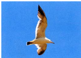
市の鳥 かもめ (平成 8 年 10 月 1 日制定)

市庁舎の落成を記念して制定されました。市内には、つつじで有名な公園や野生の群落があり、造園・盆栽などひろく一般に栽培され、開花時には美しい花が人々を楽しませてくれます。