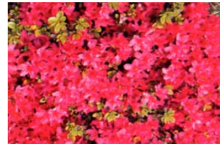
市の花 つつじ (昭和 48 年 3 月 20 日制定)

市制施行 5 周年を記念して制定されました。当地方の気候は、松の育ちに適しており、海岸線・浜街道の松並木はひろく知られています。松は百木の長といわれ、成長力が強く、本市の発展を象徴しています。