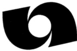
市章 (昭和 42 年 10 月 1 日制定)

※静岡県静岡市と清水市の合併により「静岡市」が誕生したことに伴い、平成 15 年 4 月 1 日から本市は「日本一広い」市ではなくなりました。