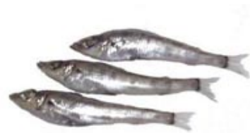
市の魚 めひかり (平成 13 年 10 月 1 日制定)

市制施行 30 周年を記念して制定されました。かもめは身近な海鳥として、ひろく一般に知られています。本市には約 60 キロメートルにわたる美しい海岸線があり、市のイメージに最もふさわしい鳥です。