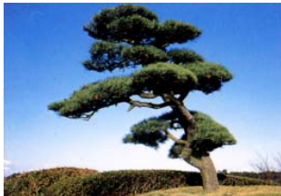
市の木 くるまつ (昭和 46 年 10 月 1 日制定)

躍動的な「い」は人の姿も意味しており、活力と熱意にあふれる市民の行動をシンボライズしています。