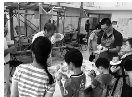
親子左官工作教室

8月22日（日） 10時～正午 所 共同職業訓練センター 内 光る泥団子などの製作 定 親子10組（応募多数時抽 選） 料 千円 申 8月16日（月）までに同校へ 電 で