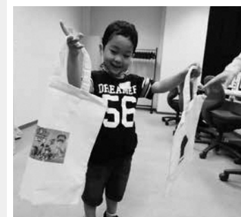
親子でペアバッグ

① 高校生を除く18歳以 上の方 ② 小学生以下と 保護者 定 ① 20人 ② 10組（い ずれも応募多数時抽選） 甲 ハガキに講座名・住所・ 氏名・年齢・電話番号を記 入し、〒970-8026 平字一丁目1 生涯学習プ ラザへ（窓口・FAX可）