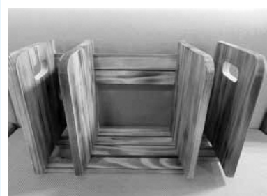
親子リサイクル木工で作った本立て

月6日（金） ③ 布ぞうり 8 月20日（金） ④ 人工シィグラ スで雑貨作り 8月25日（水） ⑤ 古紙で季節の折り紙 （花・箱） 8月31日（火） 時 ① 10時～正午 ② 11 時30分～正午 ③ 11時30 分～14時30分 ④ 11時 ⑤ 11時30分 定 ① ③ ⑤ 16人 ② 15人 ④ 11人（いずれも応募多 数時抽選） 料 ① ② ④ ⑤ 無料 ③ 100 円 申 往復ハガキの往信欄に教 室名・住所・氏名・年齢・