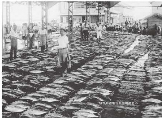
小名浜魚市場におけるカツオの水揚げ [昭和13 (1938) 年頃]