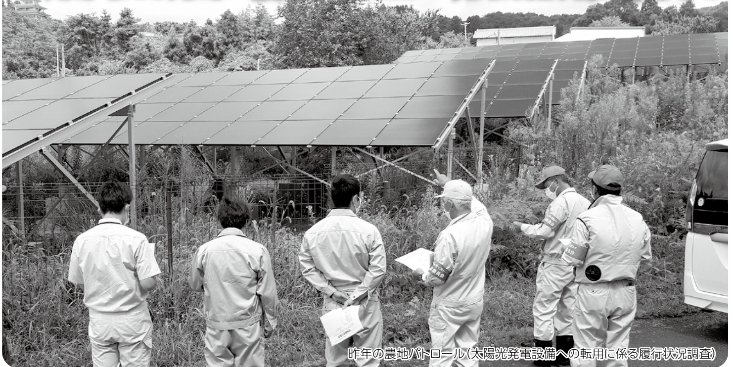
昨年の農地パトロール(太陽光発電設備への転用に係る履行状況調査)